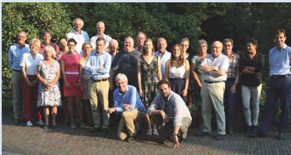
Medewerkers en vrijwilligers van de NKS.

Samenwerking, een van de steunpilaren van de nieuwe koers van de NKS, geldt ook voor de relatie met de universiteiten. Gezamenlijk wordt gewerkt aan het opstellen van een vijfjarenplan om studenten meer gericht te kunnen inzetten. Wat zijn de actuele onder-