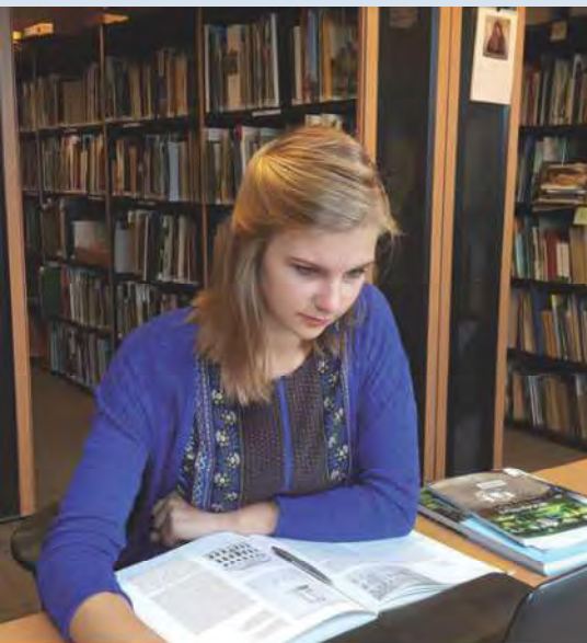
De nieuwe generatie deskundigen. Studente in de bibliotheek van de NKS in Wijk bij Duurstede.

Bij de NKS wordt je ontvangen door echte kenners, die op de eerste dag de bibliotheek voor je doorspitten en je verbijsterd achterlaten met een grote stapel boeken. Hier leer je onderzoek doen! Je begeeft je in het wetenschappelijke hol van de leeuw, je mag deelnemen aan excursies, congressen en gebruik maken van het enorme netwerk van de NKS, waardoor vrijwel alle kasteeldeuren voor je openstaan. Je ontmoet er medestudenten van andere vakgroepen en universiteiten. Sociaal geografen, kunsthistorici en bouwhistorici, maar ook studenten uit Wageningen weten voor hun bachelor- of masterscriptie hun weg naar Wijk bij Duurstede te vinden. De begeleiders staan altijd voor je klaar, maar daar moet natuurlijk wel wat tegenover staan. Iedere student presenteert zijn of haar onderzoek tijdens een